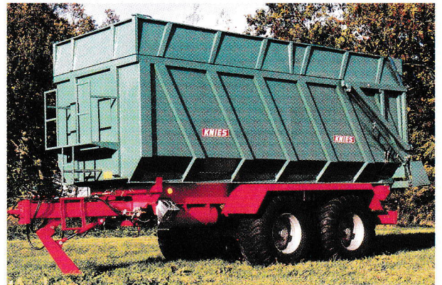
Muldenkipper mit JET Profilen von 8 t bis 22 t Gesamtgewicht