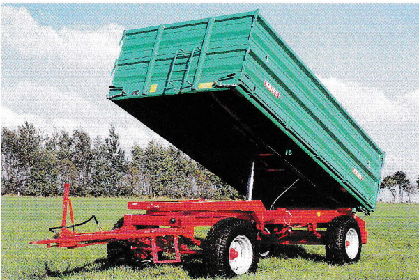
Zweiachs Dreiseitenkipper 8 t und 10 t Gesamtgewicht