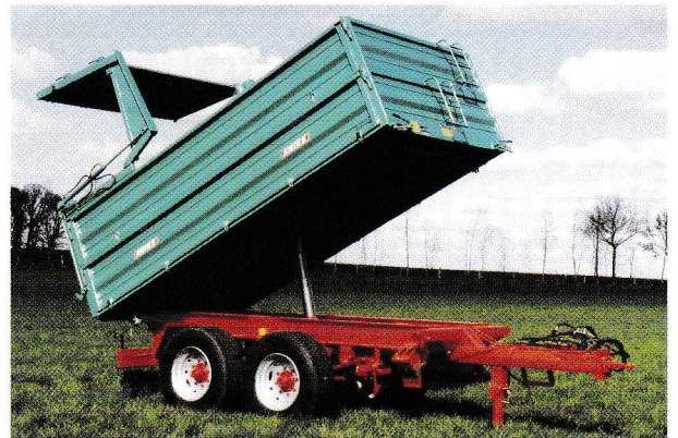
Tandem Dreiseitenkipper 14 t Gesamtgewicht, mit hydraulisch öffnender und schließender Rückwand