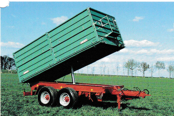
Tandem Dreiseitenkipper 18 t, 20 t und 22 t Gesamtgewicht