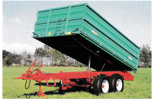
Tandem Dreiseitenkipper 8 t und 10 t Gesamtgewicht