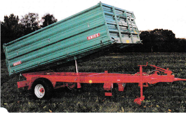
Einachs Dreiseitenkipper 6 t und 8 t Gesamtgewicht